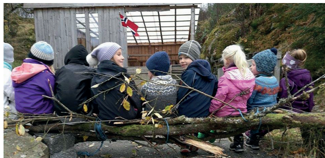
Bålsamling med gapahuken i bakgrunnen.

Hjarteleg velkommen til å vere med på bålsamlingar med Løvegjengen! Vi treng også fleire leiarar, så om du synst dette høyrrest kjekt ut, er det berre å ta kontakt!