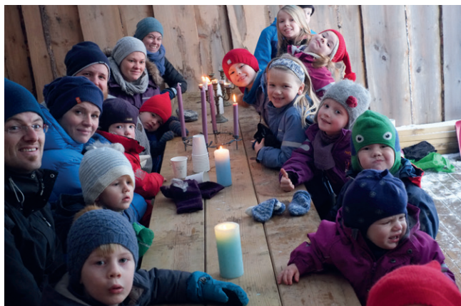
Juleavslutning i gapahuken.

For nokre år sidan fann nokre pappaer ut at dei ville byggja ein gapahuk som Løvegjengen (søndagsskulen) kunne bruke. Denne har borna fått stor glede av. Samlingane i gapahuken kallar vi «bålsamlingar», og dei er hovudsakeleg for born frå 6-årsalderen og oppover. Bålsamlingane består av ei forteljing frå Bibelen, ein kjekk aktivitet, og noko ein kan grille eller varme på bålet. Vi prøver å ha bålsamlingar i gapahukane så ofte vi har leiarar til det, og i alle fall ein gong i månaden. Løvegjengen har hatt sommaravslutningane sine her fleire gonger, og i fjor hadde vi juleavslutninga der òg. Det gjekk veldig fint å eta julegraut i gapahuken!