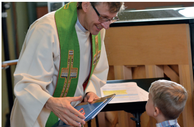
Utdeling av 4-årsbok i Meland kyrkje.

Det gler meg å sjå unge familiar finne plassen i husgrupper og på gudstenester. Dei veikaste sidene har vel i dei seinaste åra vore det å invitere, inkludere og ta vare på nye i kyrkjelyden. Og ungdomsarbeidet treng ei revitalisering. Det er få aktive i alderen 16-26 år i kyrkjelyden.