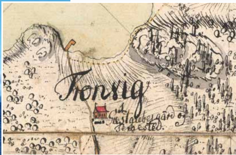
Kart fra 1805 viser at det i tillegg til havn også var gjestgivergård på Tronvik.

I 1663 kom det kongelige forordninger om etablering av gjestgiverier, og senere ble ordningen med skyssskifte knyttet til gjestgiveriene. Når de reisende kom fra Follo gjennom Moss, var det gjestgiveri og skyss-