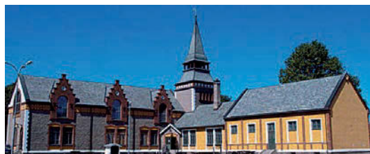
Feltkirke på Bastøy, og Kirke-gymsal-skolehuset på Bastøy