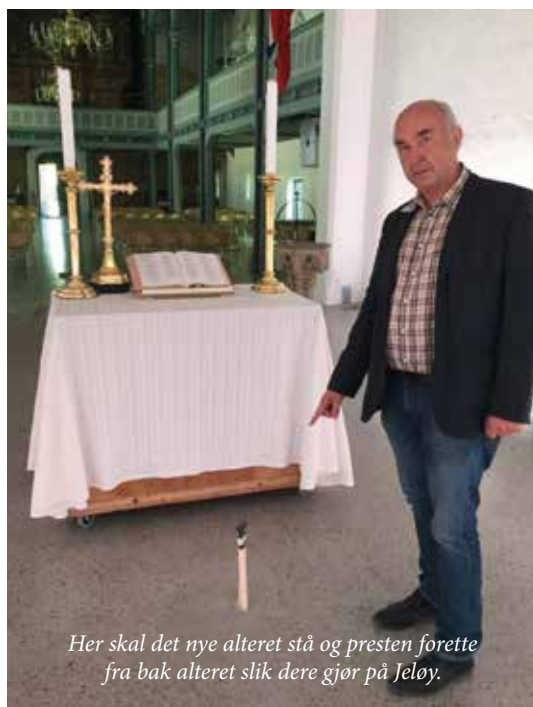
Her skal det nye alteret stå og presten forette fra bak alteret slik dere gjør på Jeløy.