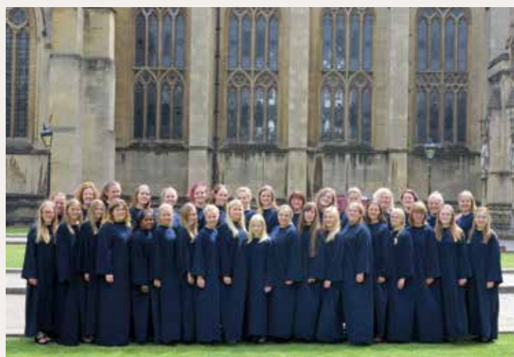
Siste konsert for ungdomskoret ble holdt i den praktfulle Bristol Cathedral.

De fire siste døgnene overnattet vi i Cardiff, hovedstaden i Wales, en by vi fikk en god opplevelse av, ikke minst på buss-sightseeingen den siste dagen.