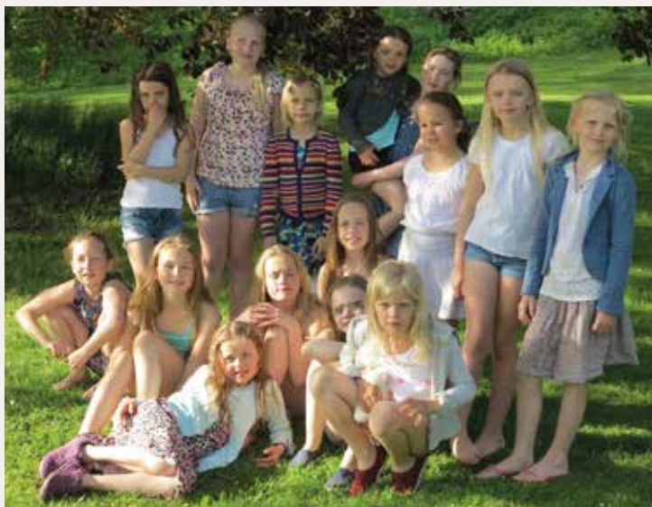
Aspirantkoret var på tradisjonell sommertur til Flämsätt, med konsert i kirken.

Siste konsert på turen holdt vi i den praktfulle Bristol Cathedral, og det ble en flott musikalsk avslutning. Vi hadde fått rikelig med øvings-tid i kirken, og det er viktig når man skal prestere bra i så store kirkerom. Før konserten