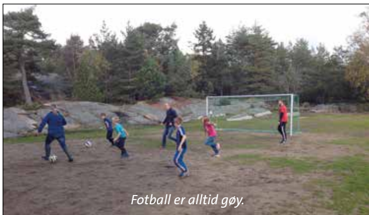
Fotball er alltid gøy.