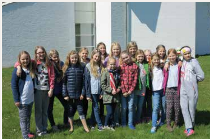
Barnekoret har vært i København og sunget i Korsvejskirken og Sklegårdskirken.

Fra fredag 5. juni om morgenen til søndag 7. juni om kvelden var Jeløy Kirkes Aspirantkor på sin tradisjonelle sommertur til Flämslätt stifts- og konferansgård ved Skara . Tradisjonen tro ble foreldre invitert med, og alle sangerne hadde med seg minst ett familiemedlem. Det synes vi gjør aspirant-korturen ekstra hyggelig, og Flämslätt er