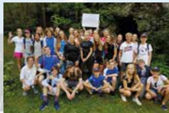
Jeløykonfirmantene klare for Kragerø-lekene.

I tillegg til konfirmantene var det med ca. 100 ungdomsledere, mange frivillige voksne (foreldre) og ca. 15 ansatte fra konfirmantene menigheter. Fra Jeløy hadde