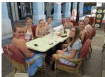
Lunsj på Plaza Mayor i Palma.