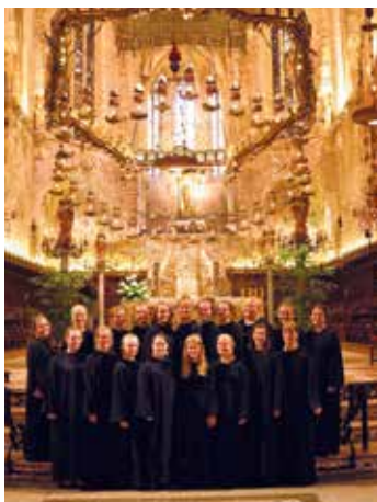
Koret etter konserten i katedralen i Palma.

Det vi gledet oss mest til var å få synge på gudstjeneste og med påfølgende konsert i katedralen i Palma, en av verdens mest be-