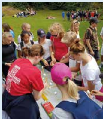
Jeløykonfirmantene i aksjon under Kragerø-lekene.

vi med noen ungdomsledere, flere foreldre og ansatte.