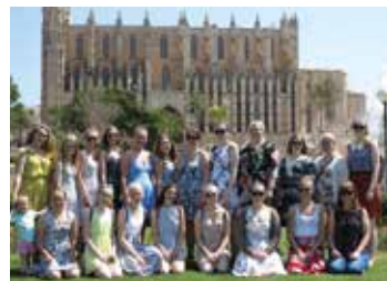
Koret foran katedralen i Palma.

Tusen takk for en fantastisk opplevelse!