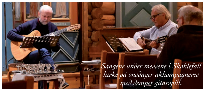
Sangene under messene i Skoklefall kirke på onsdager akkompagneres med dempet gitarspill.