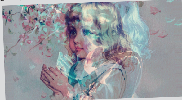
Illustrasjon: Willem de ATF

Da skal det handle om mysteriet som skjer når vi sår et frø i jorda. Og det skal synges sanger om det. Alle barn vil dessuten få en liten gave: Et frø som de kan ta med seg hjem. Der kan du ta vare på frøet, vanne det og se det spire, vokse og bære frukt. Våronngudstjenesten er en del av trosopplæringsarbeidet. I mars var det våronngudstjeneste i både Skoklefall og Gjøfjell kirker.