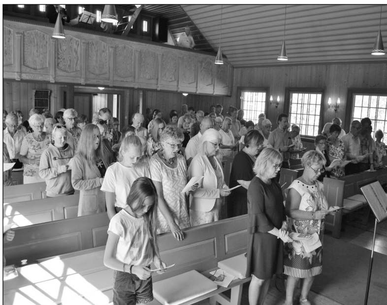
Her er hele forsamlingen som deltok under 60-årsjubileet for Tisleidalen kirke fotografert foran kirkebakken. Etter gudstjenesten var alle innbudt til kaffe og kaker på kirkebakken.