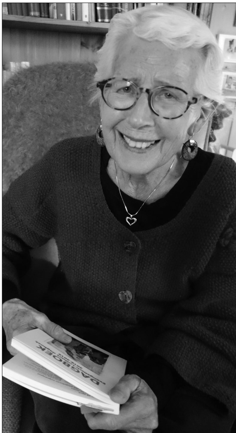
- Søndagens gudstjeneste betyr alt i mitt kristenliv. Gudstjenesten er fellesskap og et sted for ro, fornyelse og ettertanke.

gåte, og når det blir grobunn for en ekstrem retning, opplever vi jo daglig grufulle hendinger. Som jeg sa, er jeg ganske liberal i min kristentro. Når det for eksempel gjelder homofili, vil jeg gjerne stå frem åpen, for alle er vi skapt slik vi ble, og tiden vi lever i har gitt rom for det. Så mange ulykkelige sjeler har gjennom tiden måttet leve med sin legning i det stille. Det synes jeg er vondt.