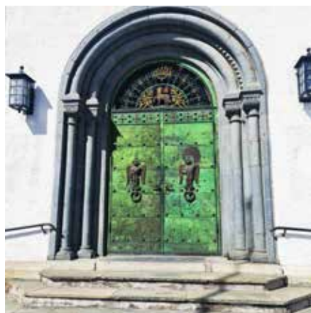
Flott kirkedør i domkirka

Til slutt ble vi servert en overraskelse i form av nystekte vafler med tilbehør i haven til bispegården, og en hyggelig prat. Vi som kom fra Nord-Aurdal var enige om at vi hadde hatt en hyggelig og lærerik dag på Hamar.