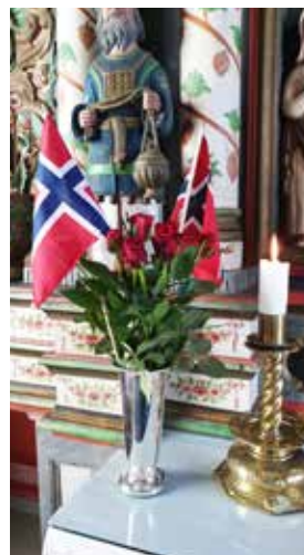
Det var 27 personar i kyrkja til ei triveleg gudsteneste.