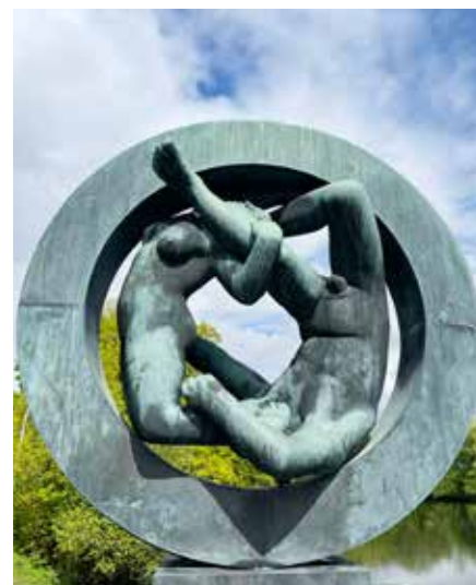
Livshjulet laget av Gustav Vigeland.

Noen opplever dette hellige nærværet, de tynne stedene også på andre arenaer - i gode samtaler i godhet, nærhet og kjærlighet med andre mennesker, i kirken, når en ber, gjennom bildende kunst, dikt, musikk, når et barn sovner i armene våre eller når vi sovner på armen til en vi er glad i. Men også når vi er i møte med livets grenser sammen med noen som er