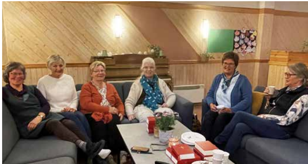
Her er noen av deltakerne i fellesskapet. De kommer fra Vang, Sør-Aurdal, Øystre Slidre og Nord-Aurdal.