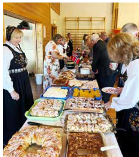
17. maikomiteen var forberedt på storbesøk.