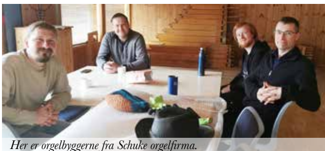
Her er orgelbyggerne fra Schuke orgelfirma.