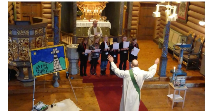
Frå tårnagentsamlinga i Kvam kyrkje i februar.

Av andre opplegg trusopplæringa har gjennomført i vinter, kan vi nemne tårnagentsamlinga i Kvam kyrkje i februar.