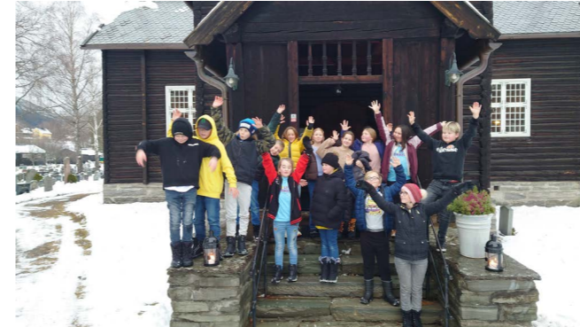
I november var fjorten 10-åringar frå Nord-Fron på Lys våken i Sødorp kyrkje.