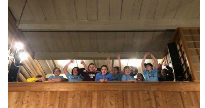
Lys vakne kyrkjeovernattarar på orgelgalleriet.

- På søndagen etter overnatting i kyrkja deltok barna med det dei hadde øvd og gjort