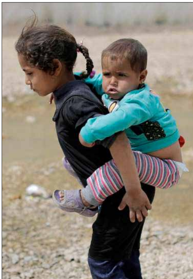
En syrisk jente bærer sin yngre bror på ryggen i en flyktningleir i Libanon.

Låtskrivere: Bob Russell / Bobby Scott The Hollies