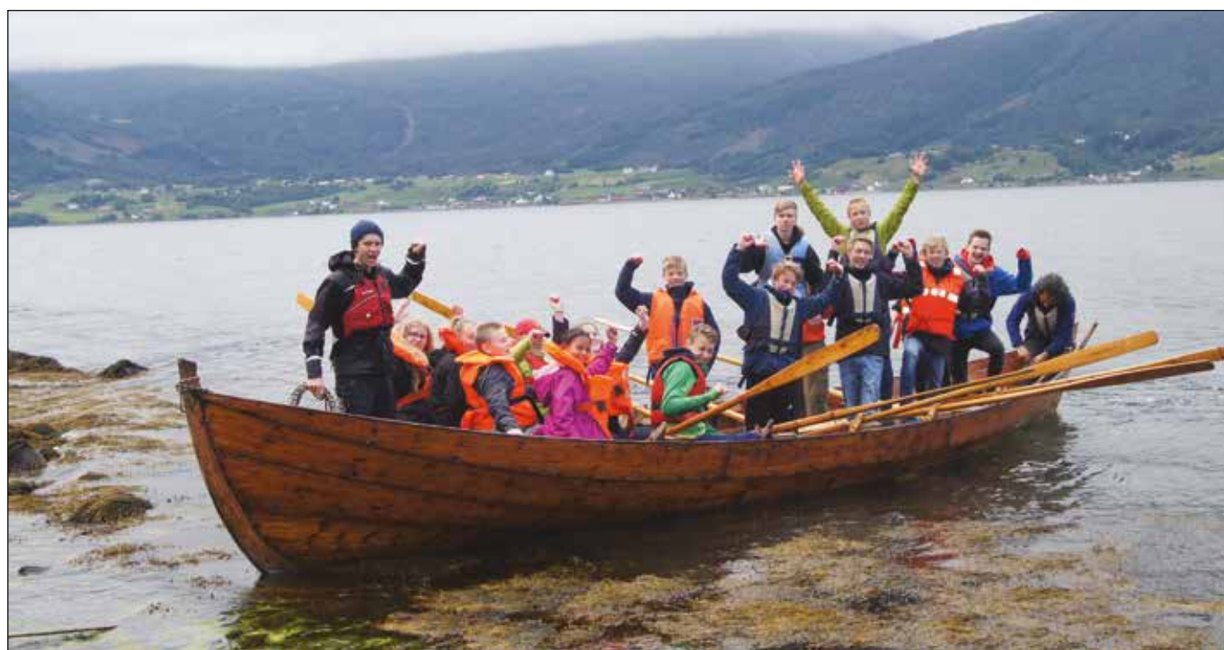
Båtliv på konfirmantleir 2019. Det er dei gamle kyrkjebåtane som vert brukt ved dette høvet.