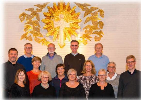
Bilde til høyre: Greverud kammerkor 2017

Kammerkoret har vært et viktig tilbud til voksne i vår menighet gjennom flere år. Satsingen på sang for voksne vil nå endres i sin form. Vi vil nå satse tydeligere opp mot gudstjenestelivet. Voksne skal få et godt tilbud og gudstjenestene skal styrkes. Hvordan dette skal gjøres finner vi ut av ganske snart.