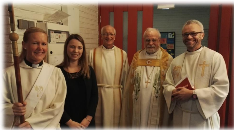
Bilde fra jubileumsgudstjenesten 5. november 2017

Som vanlig vil soknepresten presentere noen tall og utviklingstrekk for Greverud menighet. Tallene for fjorårets gudstjenester er gode. Vi satte igjen rekord for totalt antall besøkende på gudstjenester. I 2017 var det nesten 11 000 besøkende, opp 590 fra året før som også var rekord. Noe av økningen skyldes at vi har regnet med flere gudstjenester enn tidligere. Vi hadde også kirkekulturfestival og jubileum som trakk opp tallene. Antall til nattverd økte med nær 6 %.