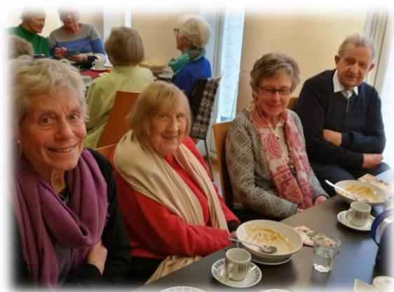
Bilde til venstre: Formiddagstreff.