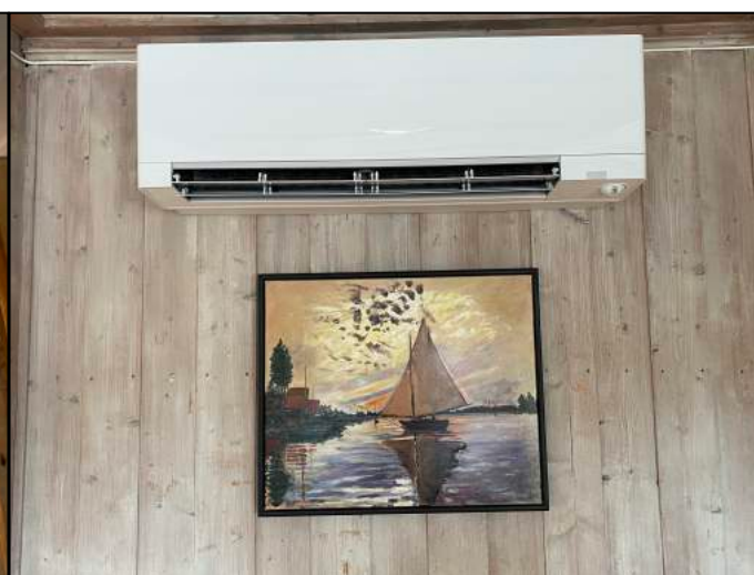
Matsalen 2 etg.