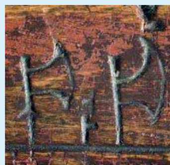
Dagen er markert med en øks på primstaven

Etter gudstjenesten i Kråkstad kirke serverer menighetsrådet rømmegrøt i prestegården. Gudstjenesten starter klokka sju, og datoen er altså 29.juli.