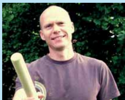
Naturlig menighetsutvikling Side 4