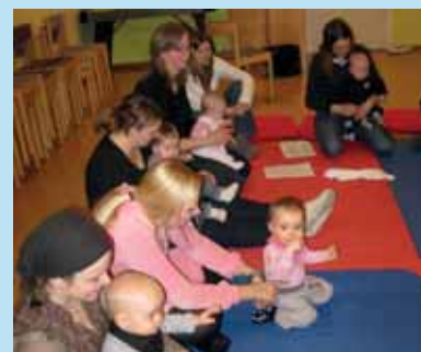
Babysang i Ski nye kirke Side 5