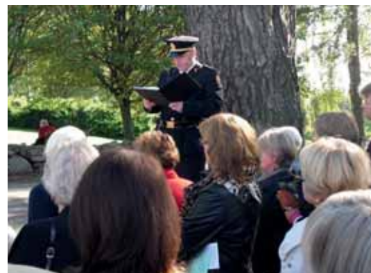
Ski middelalderkirke, fra et spill etter gudstjenesten