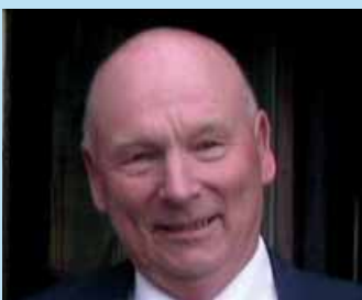
Trenger vi kristne verdier? Side 4

Vi ønsker alle våre lesere en god jul og et godt nytt år!