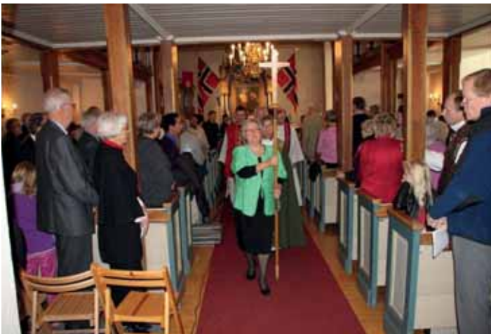
Fra jubileumsgudstjenesten i Kråkstad Kirke.