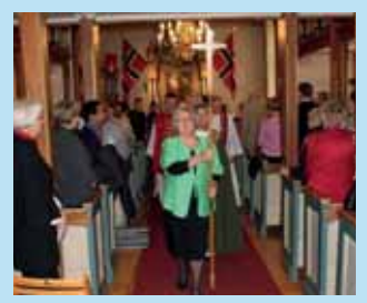
Jubel en uke til ende Side 8