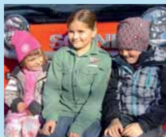
Høstfesten – en suksess Side 7