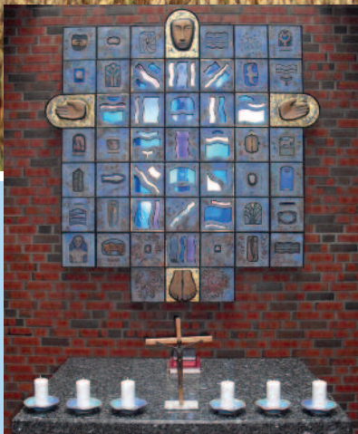
Messe-mat-mening side 4

Gud skapte jorda med blomar og strå. Han vil vi takke for dette! Kornet, som bonden ein vårdag får så, veks og vert brød som kan mette. Svein Ellingsen.