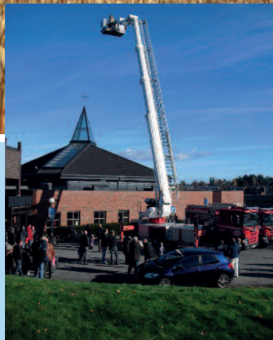
Høstfest igjen side 6