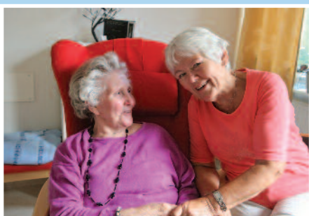
Besøksvenn - noe for deg? Side 3