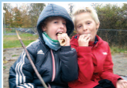
Aktivitetsskalendar for Kråkstad og Ski. Side 4 og 12