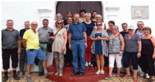
Hele gjengen foran kapellet oppe i fjellene.