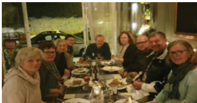
Middag i Calahonda.