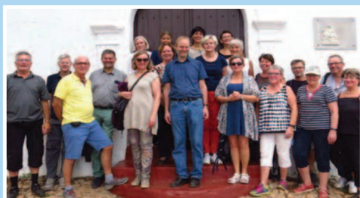
Skimix i Spania. Side 3