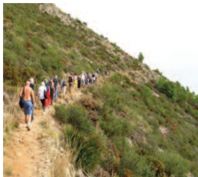
Stille vandring i fjellene i Mijas.

Vi hadde en flott tur til byen Mijas der vi gikk en «stille vandring» i fjellene som ble avsluttet med et godt måltid på en av byens gode restauranter. En heldagstur til Granada med Alhambra og Generalife stod også på programmet. En svensk-spansk guide gjorde omvisningen riktig interessant.