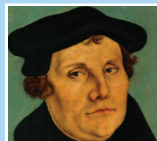
Luther fryd og gammen. Side 7