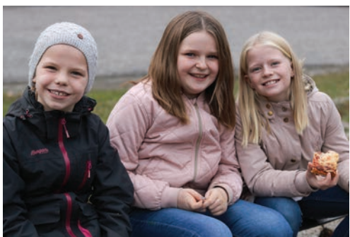
Etter skoletid: Maten smaker best ute