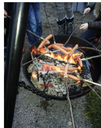
Etter skoletid og bålpanne hører sammen

Vil du vite mer? Følg med på hjemmesiden: www.ski.kirken.no