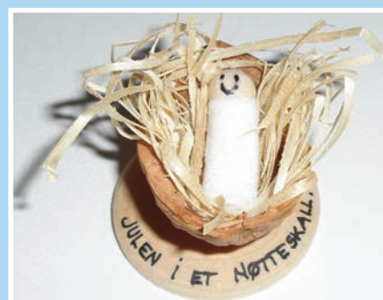
Julen i et nøtteskall Side 8