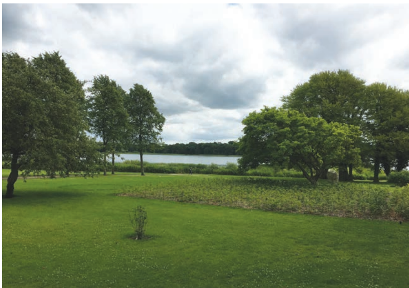
Med denne utsikten fra sin embetsbolig i Sorø satt Ingemann og skrev «Deilig er jorden».

«Deilig er jorden» kjenner vi alle, men noen har stilt spørsmålet om jorden er deilig. Salmedikteren Ingemann fokuserer på siste linje i 3. vers «...oss er i dag en Frelser født», og det er dette faktum som både gir håp og som gjør jorden deilig!