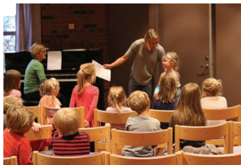
Øvelse i Yngel

Begge korene opptre på Storfamiliegudstjenester, på Høstfesten og av og til på konsert i forbindelse med korseminar.