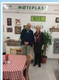
Gjenbruk er trendy Side 7