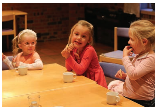
Det smaker med boller og brus etter øvelsen