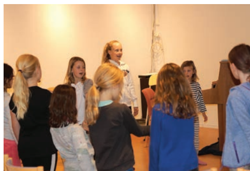
Øvelse i Wongel