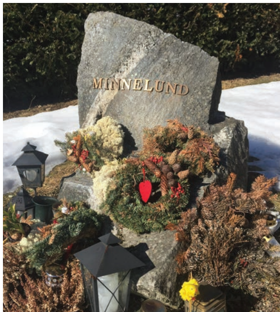
Ski kirkegård: anonym minnelund

Givertjenesten Ski menighet: 1644.05.99730