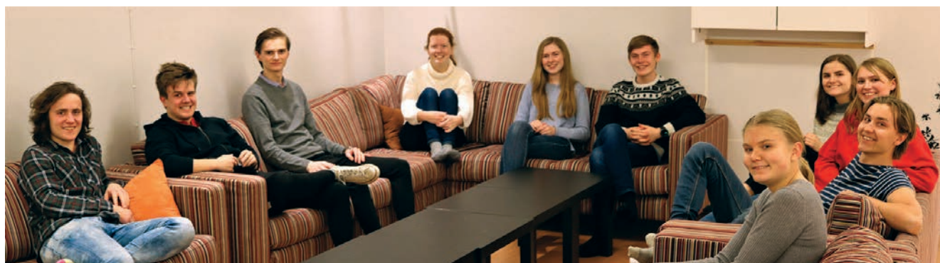
SportY-gjengen finner seg til rette

Prosjektet blir fullt og helt finansiert av menighetens givertjeneste. Over tid har givertjenesten bygget opp et ganske solid fond, men dersom "Prosjekt 2021" skal bli permanent, er det behov for å styrke givertjenesten ytterligere. De som er interessert i å være med å bidra til menighetens ungdomsarbeid, kan lese om givertjenesten på annet sted i denne utgaven av menighetsbladet.