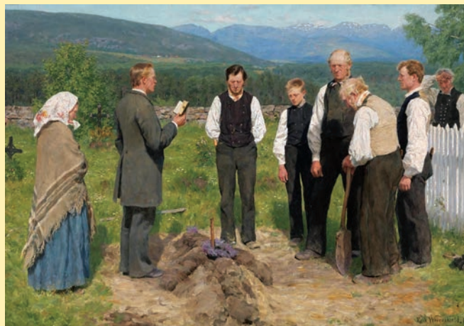
Erik Werenskiöld, En bondebegravelse , 1883-85

Tilbud om stell av grav: Ski kirkelige fellesråd tilbyr stell av grav mot en årlig kostnad. Det plantes i mai/juni, vannes og stelles fram til ca. 15. september.