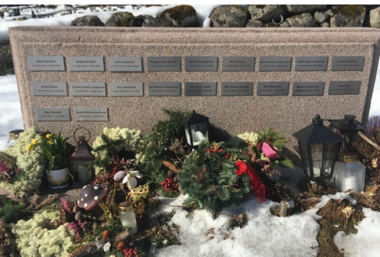
Ski kirkegård: navnet minnelund

-Det er det behov for. Men da dreier det seg ikke bare om et "rom", men om et større bygg med ganske mange hundre sitteplasser. Det er noe den nye kommunen bør se på. Etter mitt syn kan et slikt bygg med fordel legges inn mot en eksisterende eller ny kirkegård, for å utnytte synergieffekten.