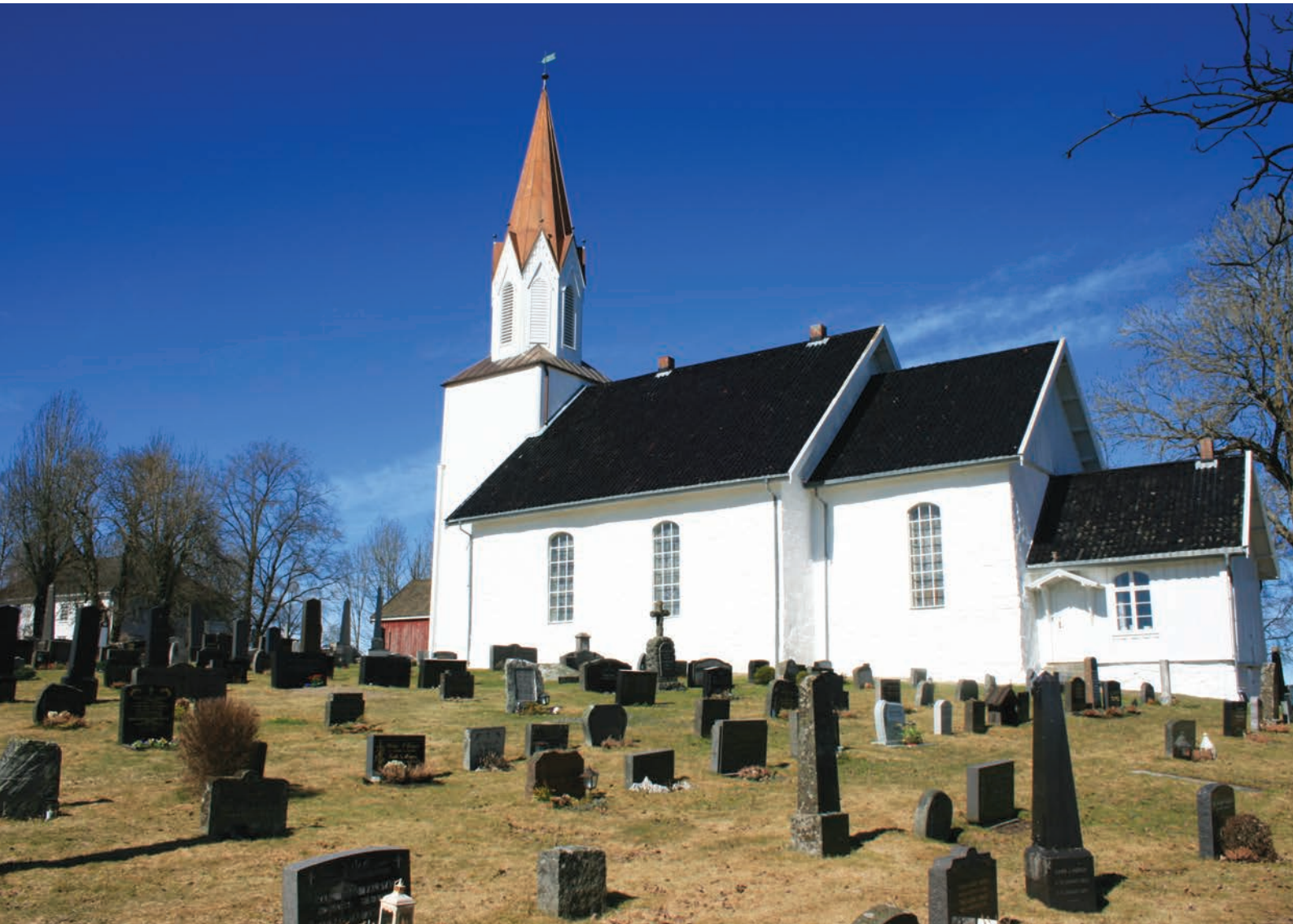
Kråkstad kirke med prestegården i bakkant.