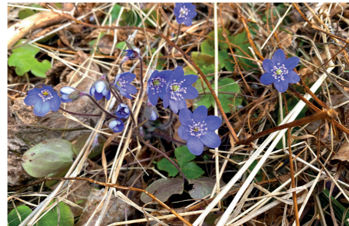
«Vi aner at noe er på gang, og vi vet hva det er og gleder oss over det og lengter etter varme og sommer.»

■ Bodil Kirkerød utfordres i neste menighetsblad