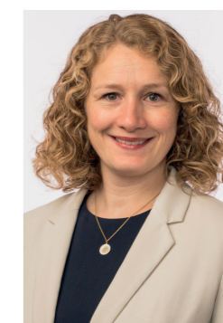
Ski har én politiker på Stortinget denne perioden, men hva heter hun?