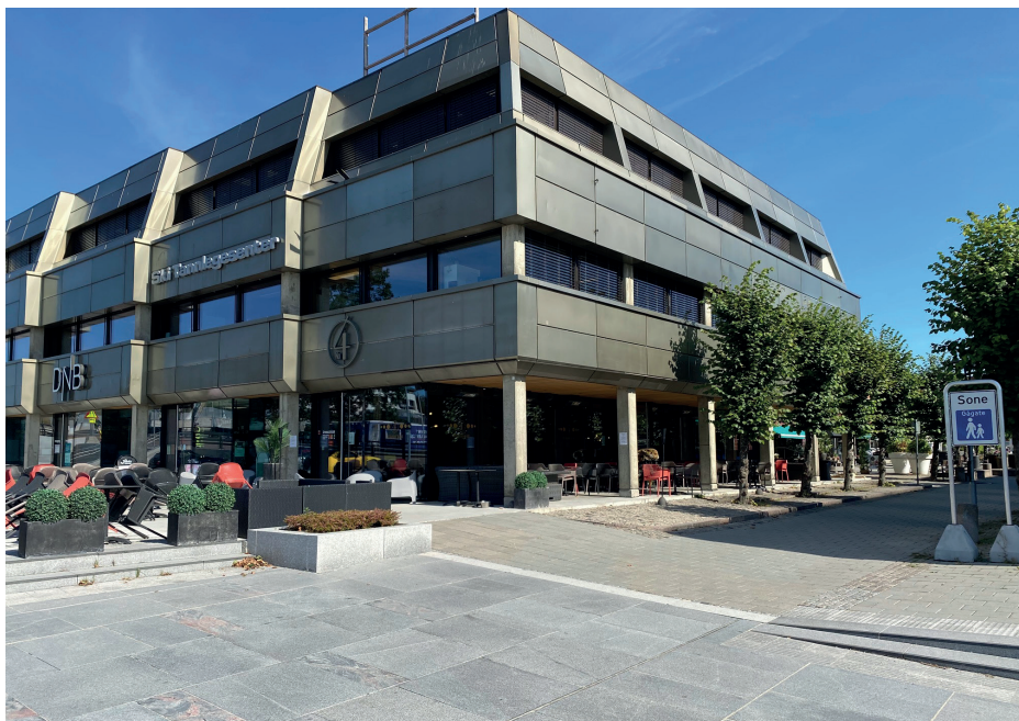
Restauranten No4 holder i dag til i de gamle banklokalene, mens andre brukere i bygget er Ski Tannlegesenter, Hjemmetjenesten og DNB.