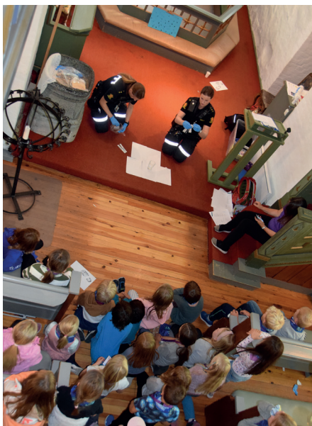
Det var populært da politiet dukket opp i Ski Middelalderkirke. De fortalte om hvordan de jobber og barna fikk prøve seg som skikkelig agenter.

Kolosserbrevet handler om Kristus og skapelsen, troen og frelsen – og om de mange utfordringene i en ny, kristen menighet.