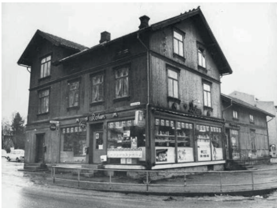
Refsumgården eller Refheim ble revet i 1974. Bildet, som er fra Akershusbasen/fotoarkivet til Ski bibliotek, ble tatt et par år tidligere.

endringene. Hvordan så det ut før der de nye byggene reises? Først ute er Refheim – eller Refsumgården i Jernbanevegen 4 – et av de første forretningsbyggene i det moderne Ski.