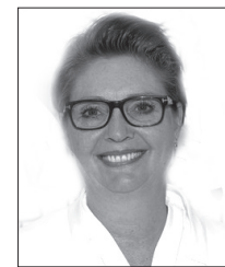
Et kjent fjes, men hva heter hun, ordføreren i Nordre Follo kommune?