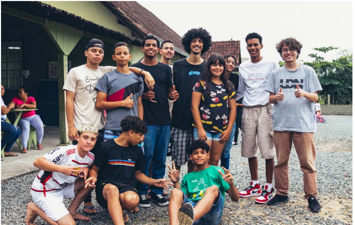
På tvers: Ungdommer som skaper vennskap på tvers av hudfarge.