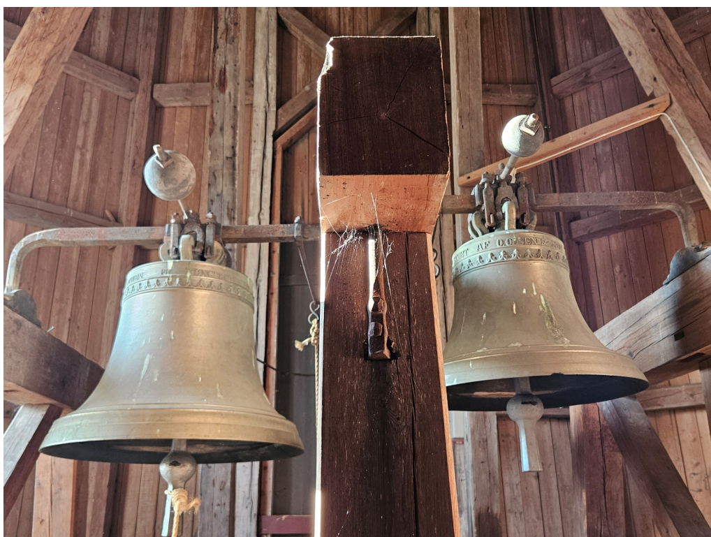
Kirkeklokkene i Sand kirke. Bildet er tatt under omvisningen i sommer.