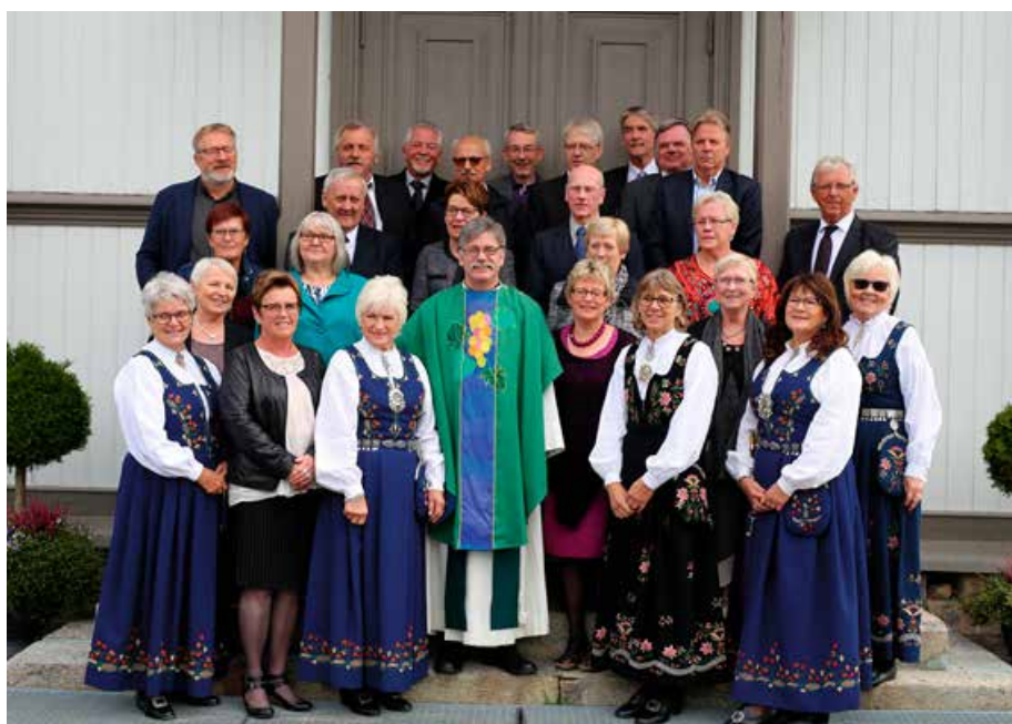
50 årskonfirmanter i Sand.

22. oktober møtes årets 50-årskonfirmanter i Mo kirke til gudstjeneste og til servering etterpå. Bilder og referat fra denne samlingen rekker ikke dette bladet, men kommer i neste