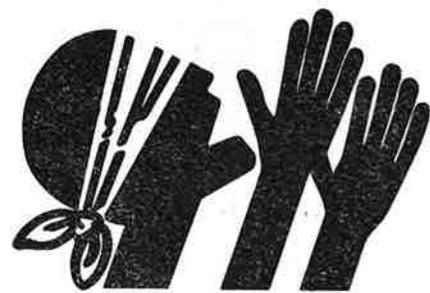
DEL ORDET MED ANDRE.