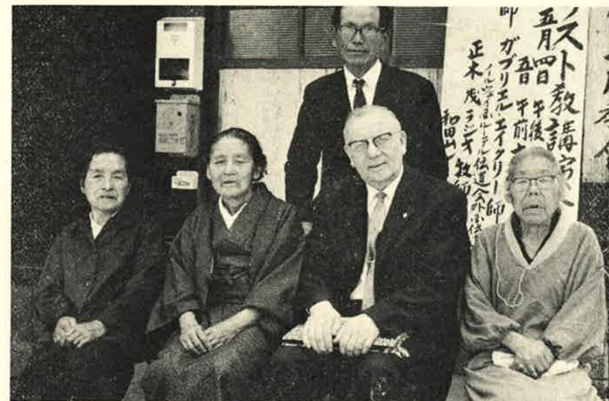
Førstegrøden i Wadayama saman med Eikli.

105 mill. mennesker finnes det mange i dag som søker etter den grunnen som holder. Alle de brev som kommer inn fra lytterne til våre evangeliske radioprogrammer forteller om denne søken etter en grunnvoll som står når jord og himmel selv forgår. En møter vakte mennesker blant det japanske folk, mange søker frelsen i Kristus og finner den. For en mulighet for evangeliet den dagen dette folk vinnes for Kristus!