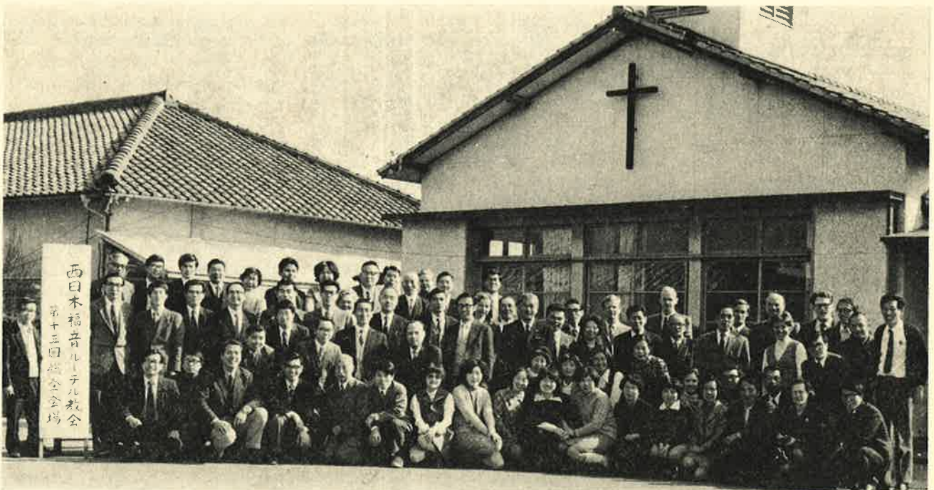
Medarbeiderkonferanse I NISHI AKASHI.