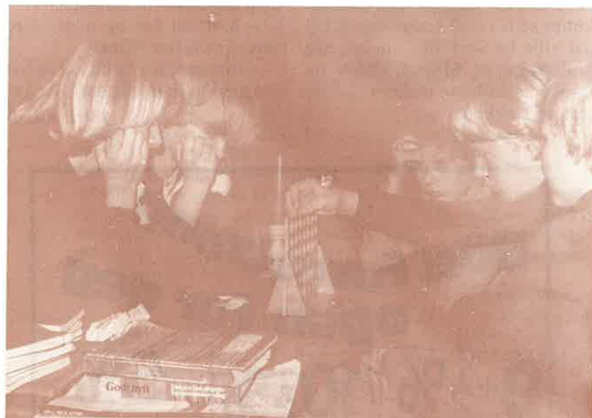
Her ser vi et glimt fra turneringen med «4 på rad». Konsentrasjonen er på topp.