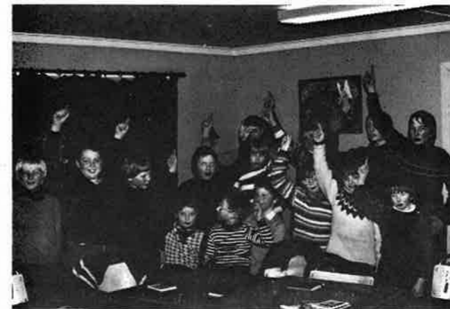
I yngreslaget ønsker vi å peke på Jesus som den eneste vei til frelse.