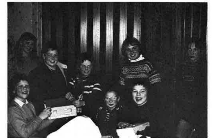
Aktive hobbyarbeidere med en del ferdige produkter i tre