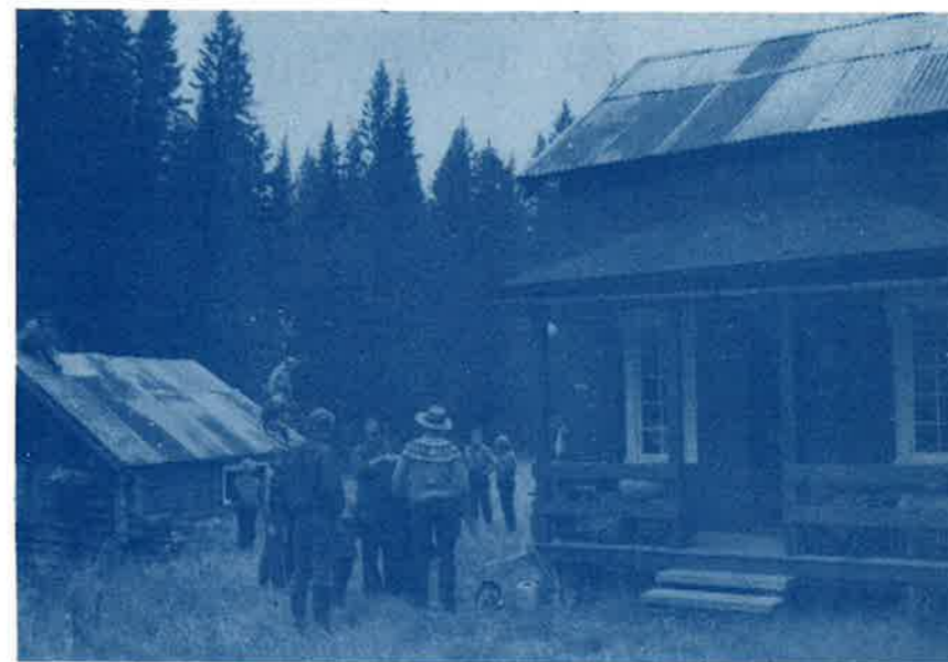
Bildet er henta frå Svorkmo-speidarane si speidarhytte - Tjønnåsen.