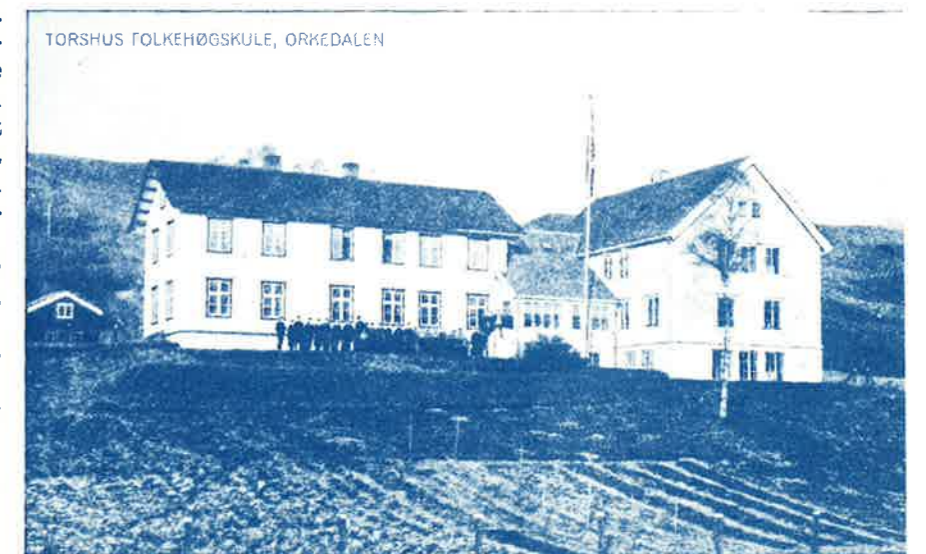
Huset frå 1882 fekk eit tilbygg i 1914.