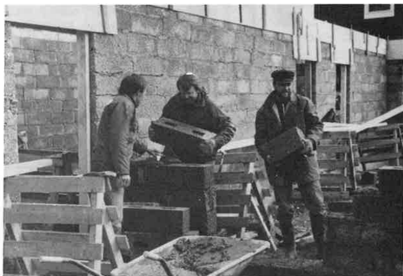
Noen glimt av dugnadsgjengen.