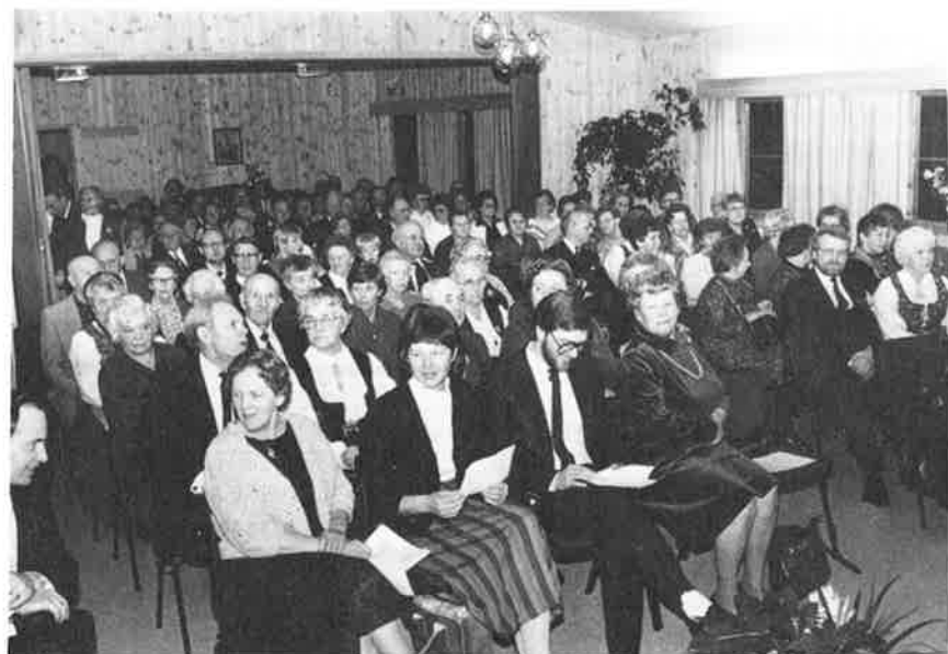
Her ser vi omlag halve forsamlinga.