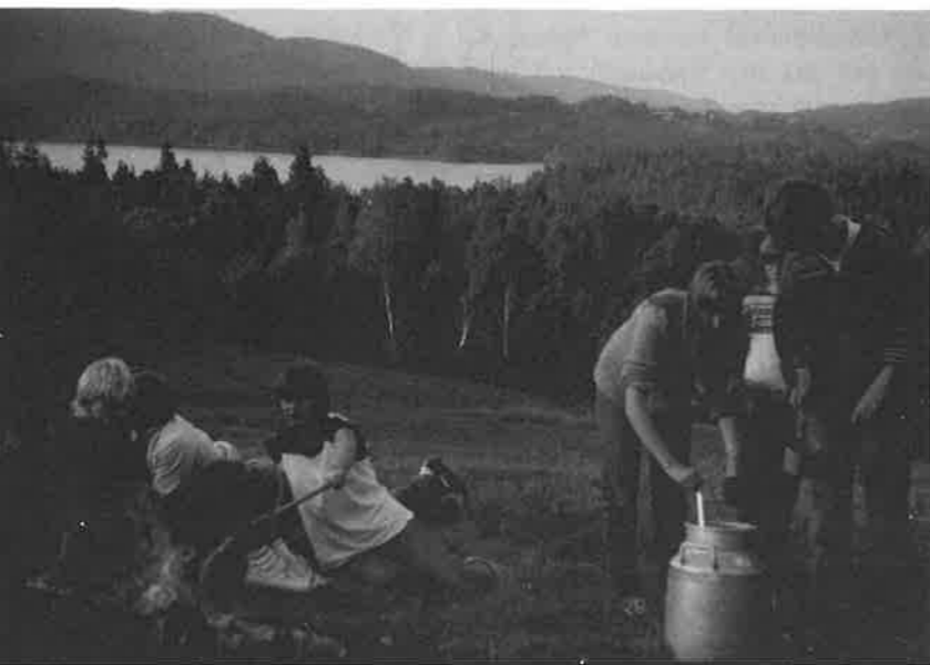
Glimt fra lørdagskvelden under Tenmisjonstreffet 1984.

Noko av det vi skal ha: nærradio bibeltimar hestskokasting luftgeværskyting