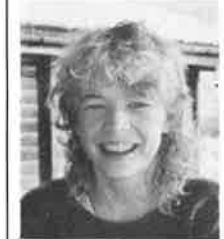
Hågen Solemsløkk Orkdal menighet