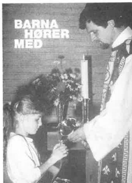
Brosjyren "Barna hører med" er lagt ut i kirken.