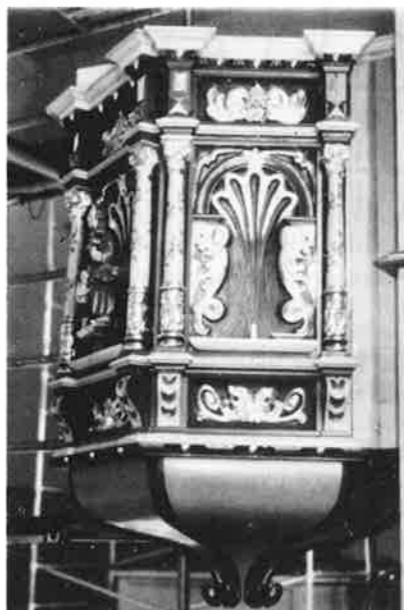
Prekestolen i nykirka.

Den nye kirka rommer omtrent det sammes antall personer som den gamle, men det er blitt mye rommeligere fordi selve kirkerommet er atskillig større enn før. På nordsiden av kirka er det flere tilstøtende rom. Prestesakristi som er bygd som et kapell, dåpsakristi, konferanserom pluss enda et disponibelt rom. Over selve kirkerommet er det også et loft som kan brukes til f.eks. lager.