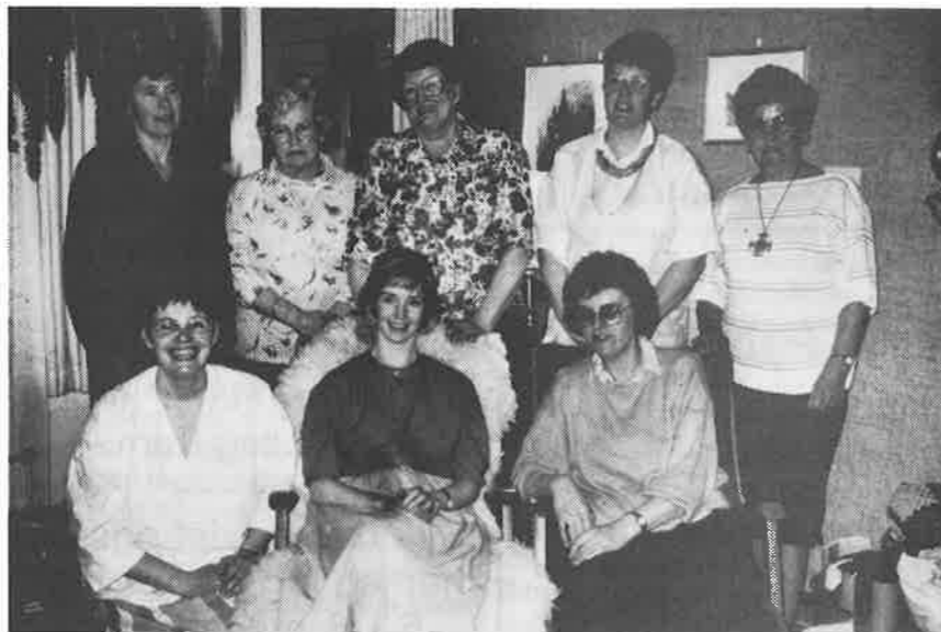
Orkanger eldre kvinneforening