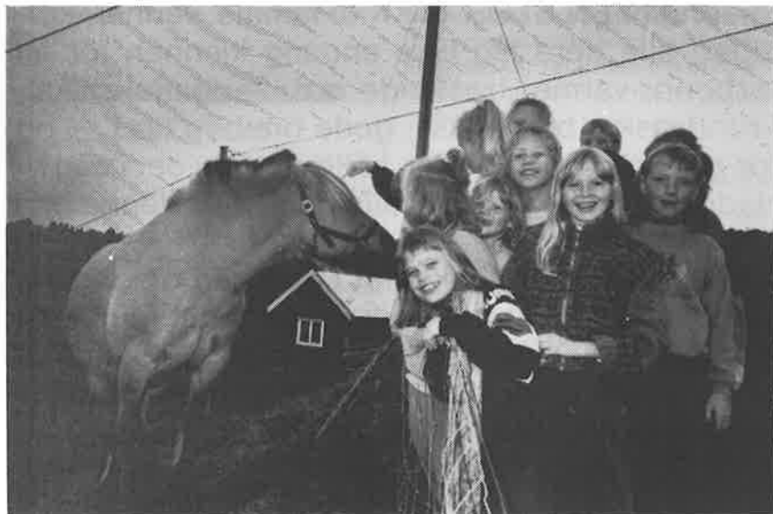
Fornøyde barn på Bakksætra

Dyrene som var på Bakksætra før overvintret på Mjuklia, men om våren kommer de tilbake til Bakksætra til lammeleirene begynner. Og leirer skal det bli for barna fremdeles på Bakksætra. Det har fellesforeninga for NMS i Orkdal bestemt. De vil stå på gjennom dugnader slik at dette populære stedet kan være et godt tilbud for barna til å bli kjente med Jesus og med misjonens viktige oppdrag.