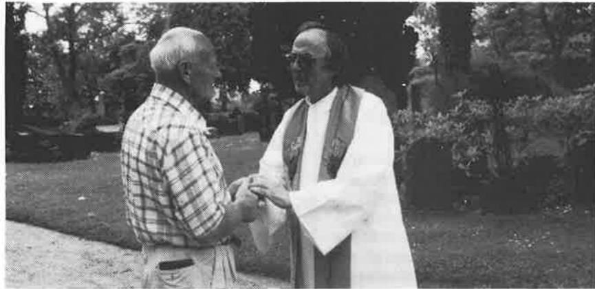
Trøst i møte på kyrkjegarden - august 1991