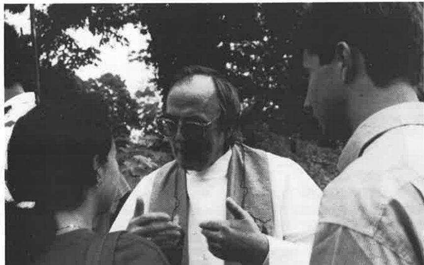
Inge Eidhamar i samtale med ungdom etter gudstenesta 4. august 1991