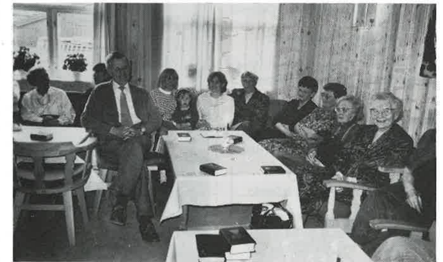
Misjonsvenner fra hele Orkdal samlet