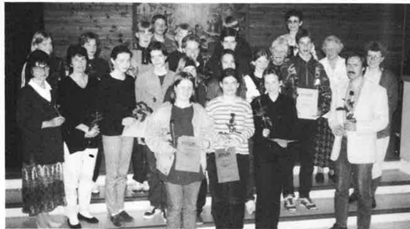
Alle kursdeltakarar og vaksenkontaktar.