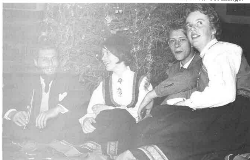
Trivelig for landkrabber og sjøfolk å møtes, ikke minst på julefest.

små, egentlig store- og omvendt? En enkel samtale med en ung gutt eller jente på kjøkenet, et fylt kirkerom, en festkveld på leseverrelset, alt hørte inn under rytmene på kirken.