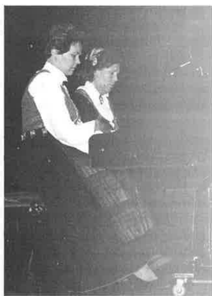
Her spilles Griegs norske danser på konsert ved H K universitetet. Marie til høyre

Det ble bygd en dansk- norsk kirke i London allerede i 1696 og det er gripende å lese om arbeidet som ble gjort både før den tid og ut fra kirken. Vår kirke i dag er fra 1927. Her prøvde vi å fortsette arbeidet de gamle begynte. Små og store hendelser fylte hverdagen. Kanskje er de som for oss virker