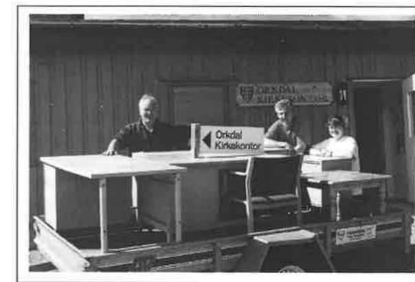
Orkdal kirkekontor på flyttefot.

Det er stadig noen som er aktive i dugnadsgjengen i Orkdal Menighetshus, og det skjer merkbare forandringer i huset. Dere som enda ikke har sett huset oppfordres til å stikke innom for å ta en titt. Det blir et utrolig bra hus som hele Orkdal vil få stor glede av.