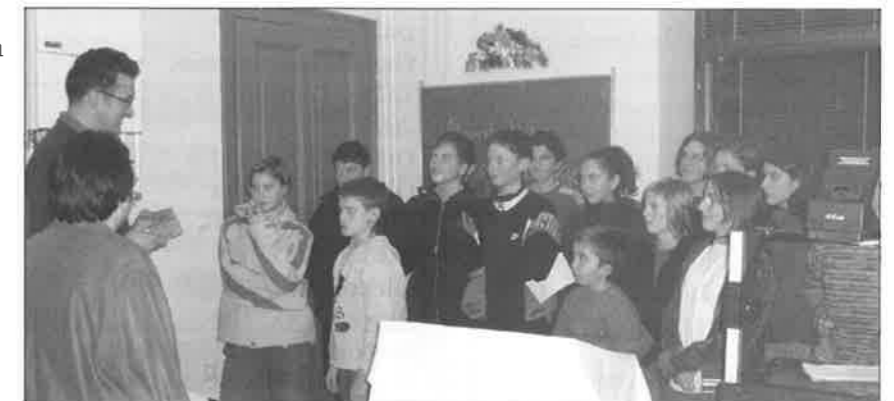
Barn i Legrad får KorAktiv sin CD