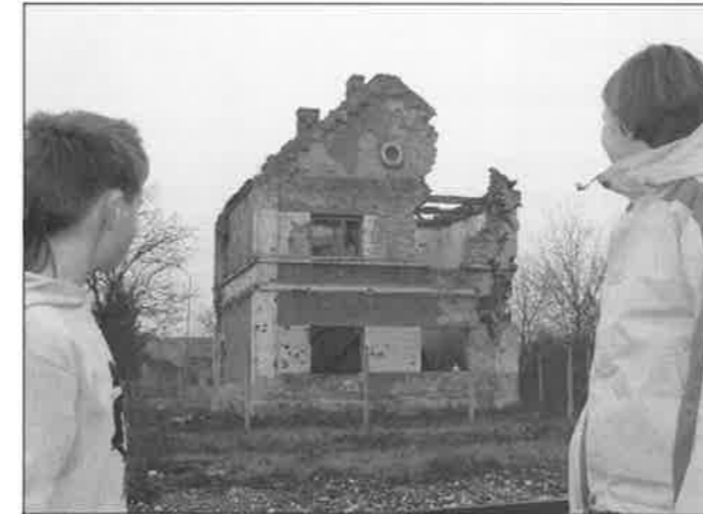
Det er behov for forsoning mellom folkegrupper etter en vond krig.