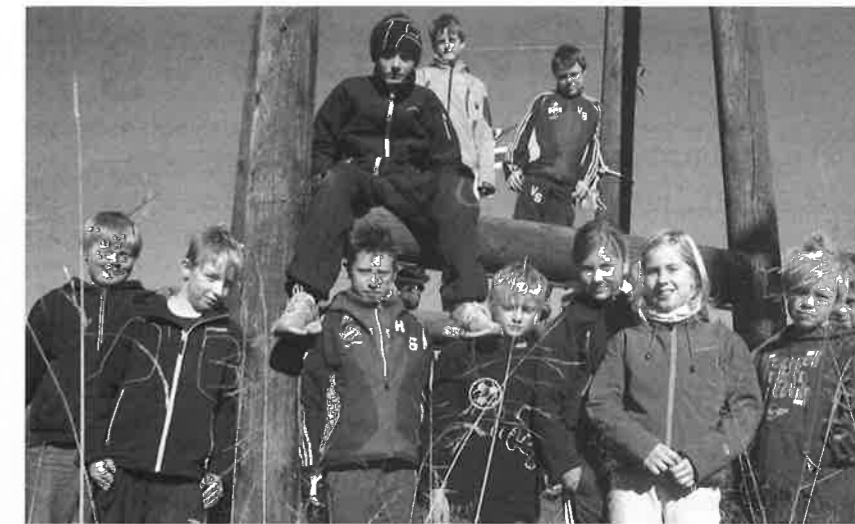
11 ELEVEN-11-åringene deltok på årets første ELEVEN-døgn på Fjellkirka.