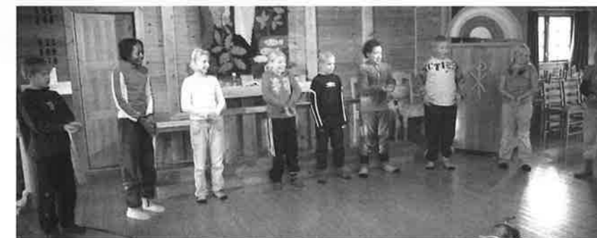
Noah-rap ble innøvd og fremført for hentere på begge "ELEVEN". Her er deltakerne på "ELEVEN" i høstferien i aksjon.