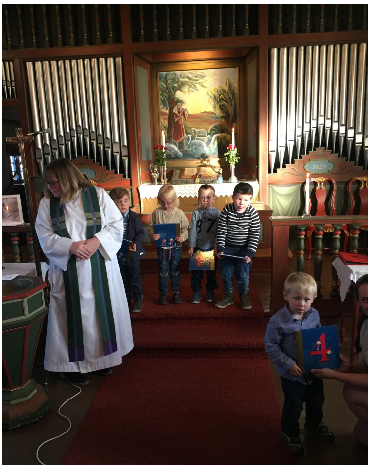
Utdeling av “Min kirkebok” til 4-åringene i Løkken kirke