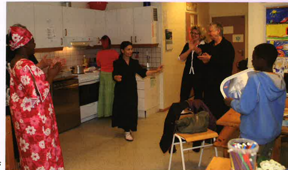
På Malaba knyttes det bånd mellom mennesker fra ulike kulturer