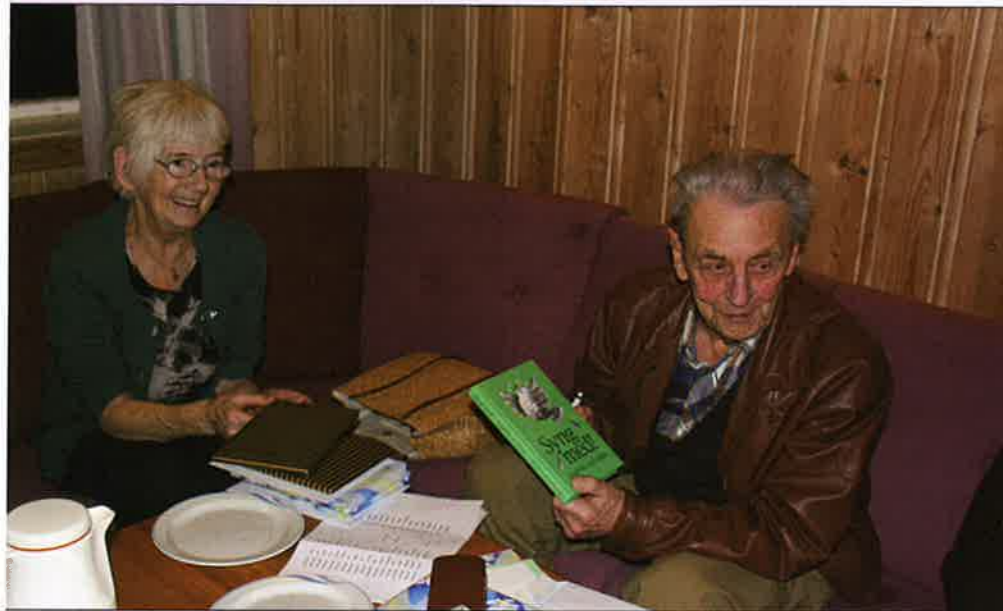
Grendekontaktene i Orkland har vært samlet for å fordele bøker og kort til jubilentene 2009.

Diakoni er kirkens omsorgstjeneste. Den er evangeliet i handling og uttrykkes gjennom nestekjærlighet, inkluderende fellesskap, vern om skaperverket og kamp for rettferdig fordeling.