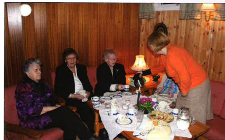
Kaffe og bløtkake når det er nyttårsfest i Eldres hyggestund, Orkanger.