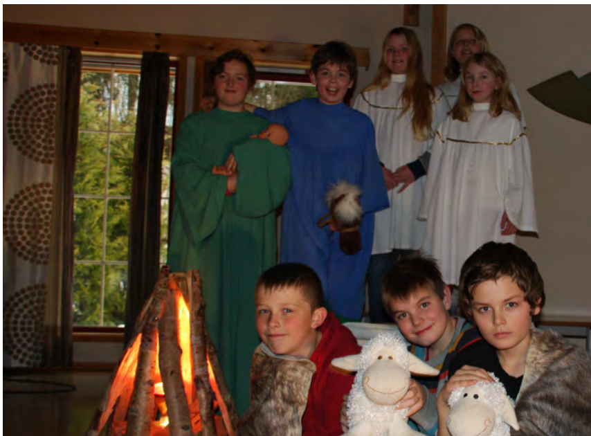
På ulikt vis ble juleevangeliet utforsket, før 10-åringene selv laget skuespill. Foreldre, søsken og besteforeldre ble invitert til forestillingen: "Det skjedde i de dager.."

Juleevangeliet er uslitelig etter 2000 år , men våre illustrasjoner de tæres gjerne av tidens tann. Slik har det også gått med julekrybba i Orkanger kirke. Men da behovet for en fornyelse begynte å bli påtrengende, kom det glade budskapet: