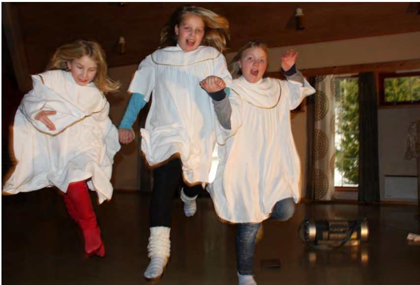
"Ære, være Gud i det høyeste", sang englene på Betlehemsmarka. Slik synges det den dag i dag i kirka.