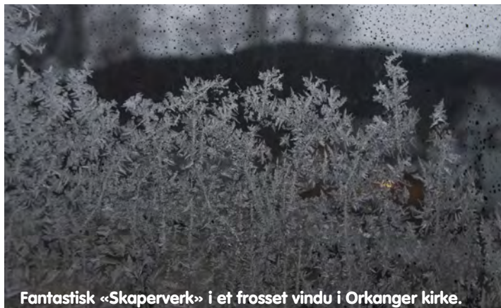
Fantastisk «Skaperverk» i et frosset vindu i Orkanger kirke.