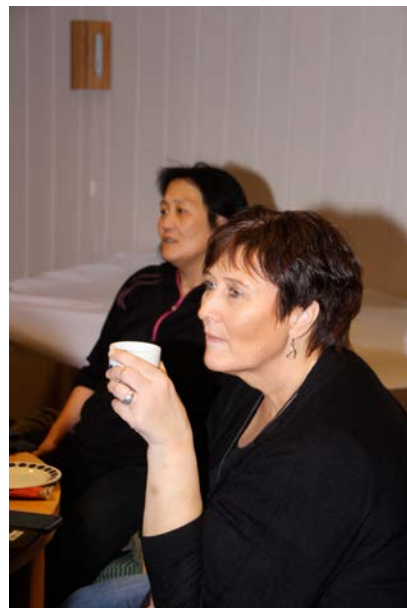
Bildene er tatt på første møte sammen med Orkanger Menighetsråd.